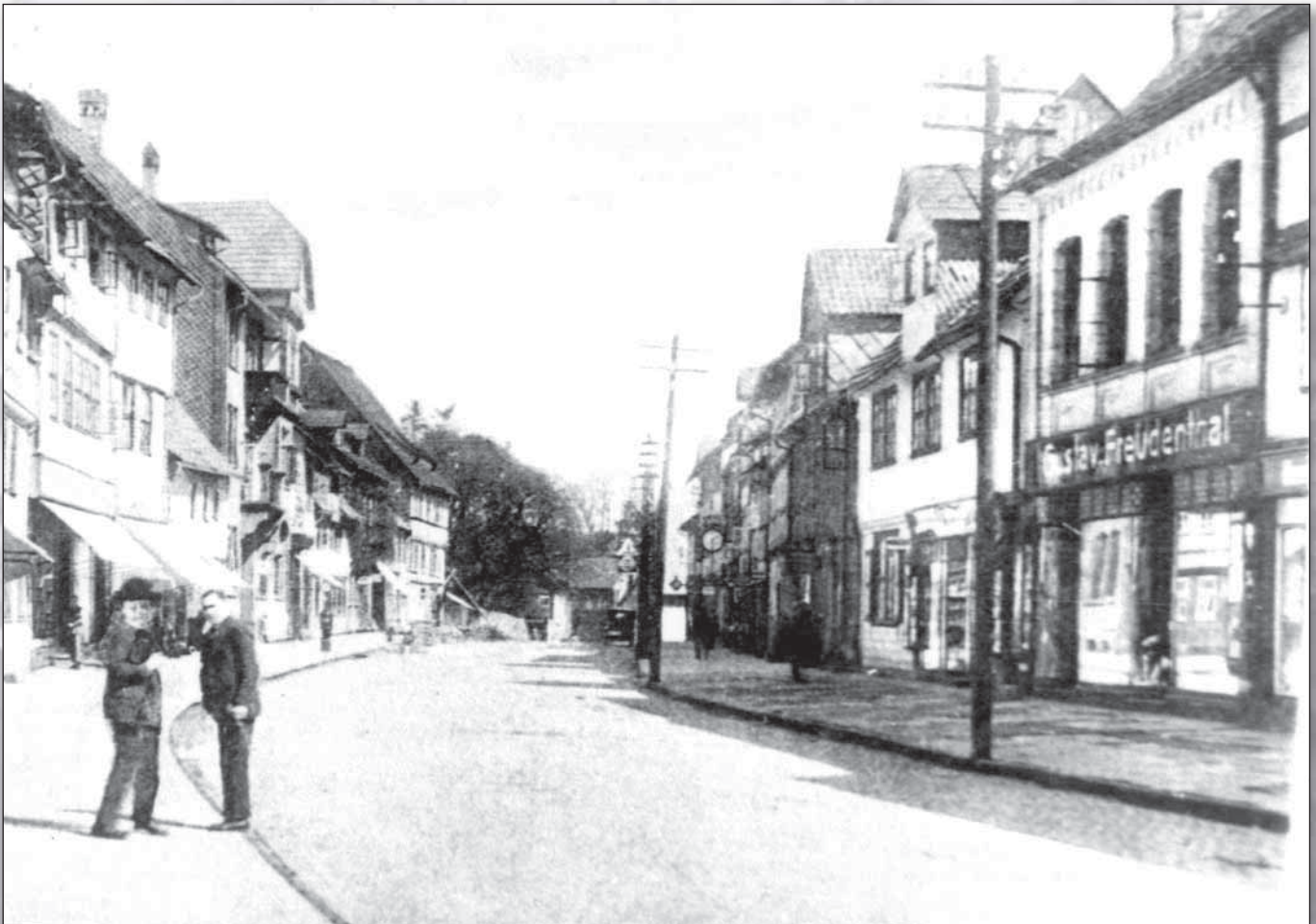
Die Lange Straße Mitte der zwanziger Jahre.