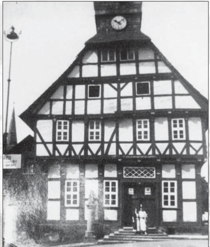
Schild am Rathaus „Juden betreten diesen Ort auf eigene Gefahr“